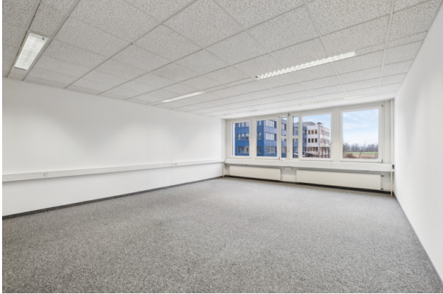
Büroraum Nr. 3