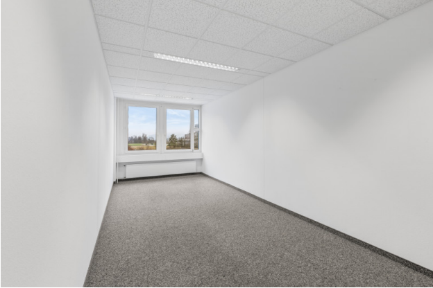
Büroraum Nr. 2