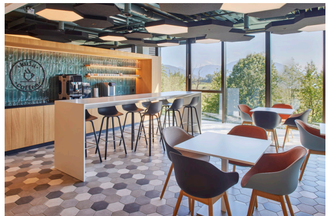
Der Coffee Corner ist der Treffpunkt im .kuia.office.