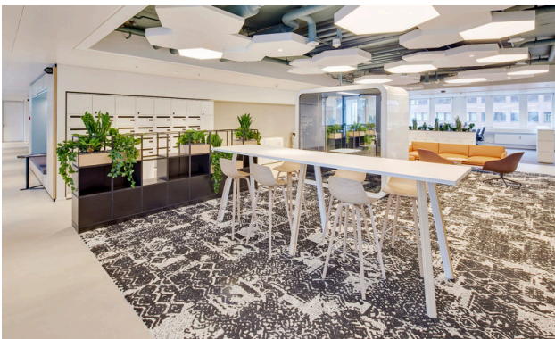
Die Hochtische und Lounges laden für ein Gespräch unter Büronachbarn ein.