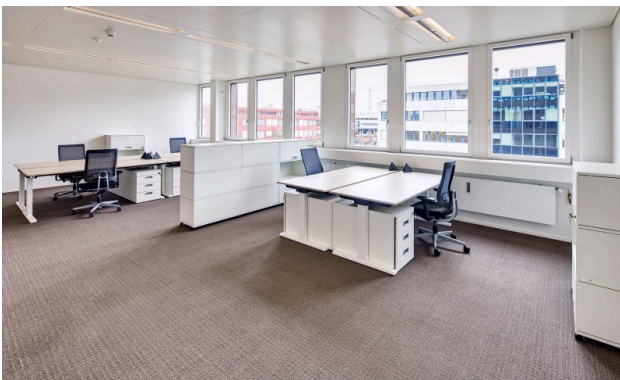
Ihr neues Teamoffice mit Kapazität bis zu 8 Arbeitsplätze (53 m 2 )