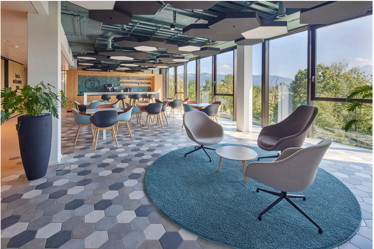
Treffpunkt für Austausch & Entspannung mit Weitblick