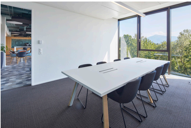
Buchbarer Meetingraum mit modernster Ausstattung, zeitgemässe Technik und Panoramaaussicht.