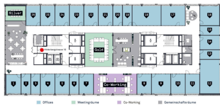
Übersichtsplan - 26 Offices / 2 Meetingräume / 12 Co-Working Arbeitsplätze / ästhetische Gemeinschaftsräume