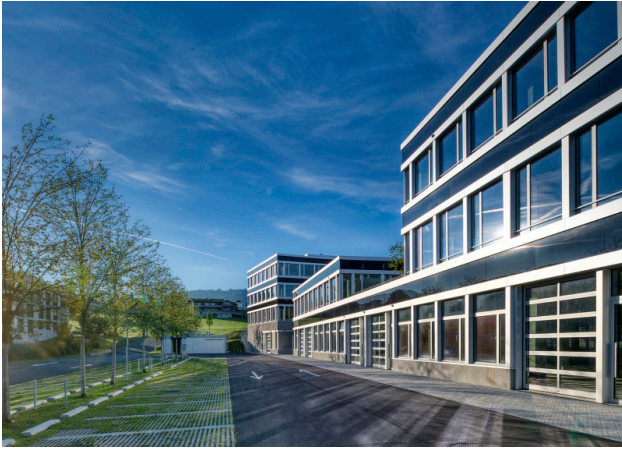
Hochwertige Glas-, Metallfassade mit Sektional-Einfahrtstoren im EG