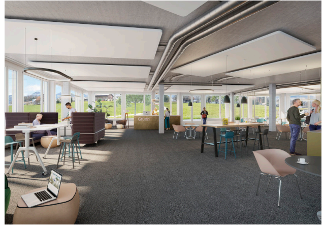
Bald Ihr eigenes Büro im 1. OG (Gebäude 1)?