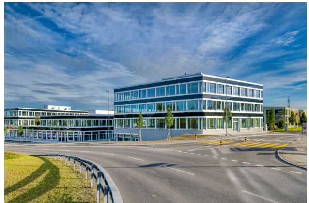
Vom Dorfzentrum Buchrain kommend mit Einfahrt Stegmattstrasse (Gebäude 1 im Vordergrund)