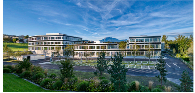
Rückseite der Gebäude 1, 3, 5 mit Pilatusblick