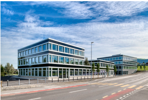
Kreuzung Dorf-, Hauptstrasse in Richtung Dorfzentrum Buchrain