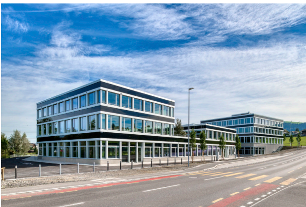
Kreuzung Dorf-, Hauptstrasse in Richtung Dorfzentrum Buchrain