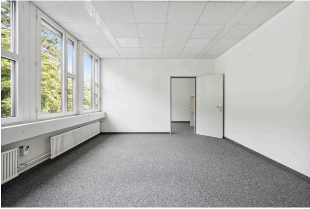
Büro 2 mit Blick ins Büro 1