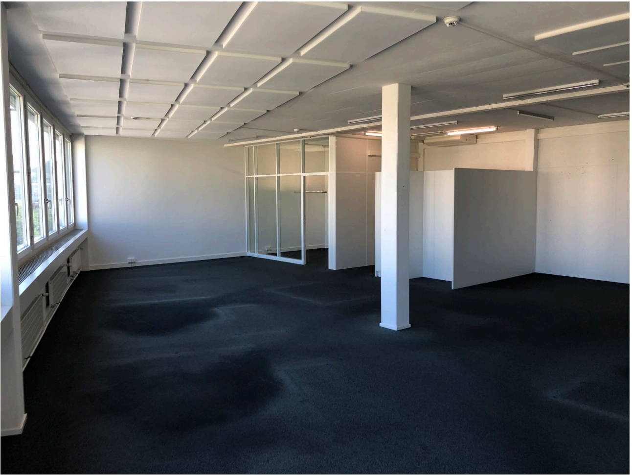
Grossraumbüro mit Blick auf Garderobe, Teeküche und Sitzungszimmer