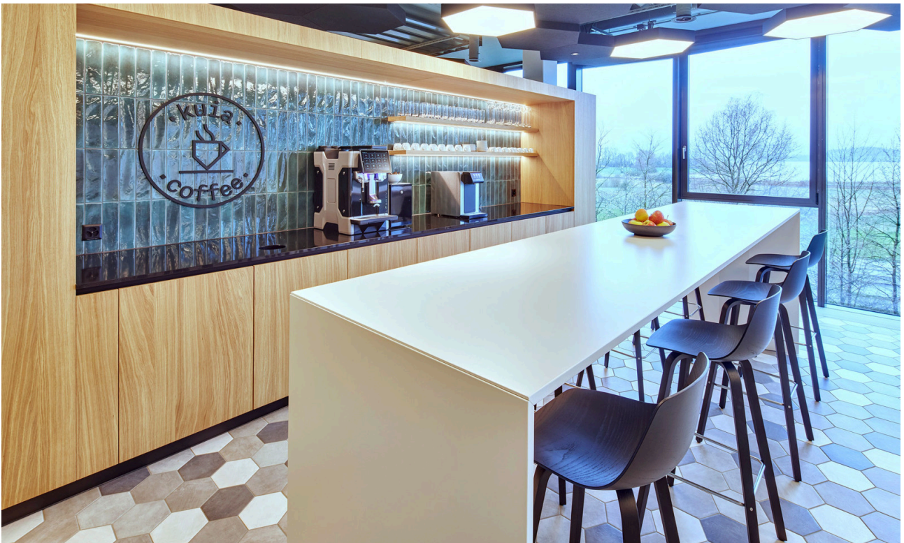
Der Coffee Corner ist der Treffpunkt im .kuia.office.