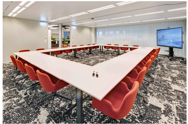
Der Konferenzraum garantiert ein ideales Setup für grössere Besprechungen.