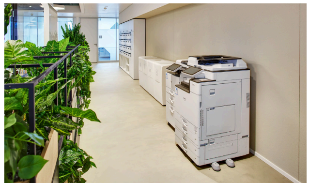
Der tägliche Postservice, die Druckgeräte (fair use) und wöchentliche Office-Reinigung sind im Preis inbegriffen.