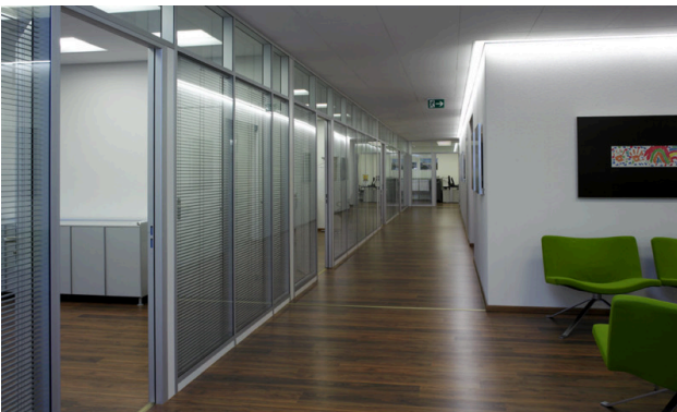
Korridor mit Glaswänden