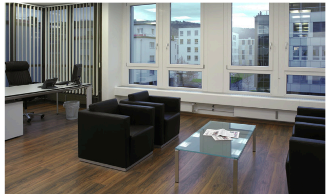
Helle und grosszügige Büros