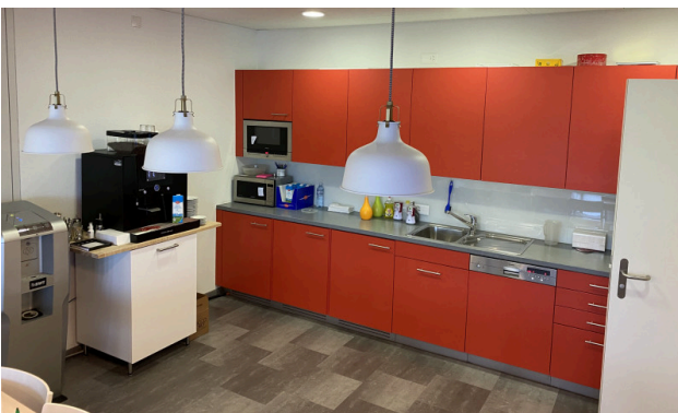
Teeküche und Aufenthaltsraum