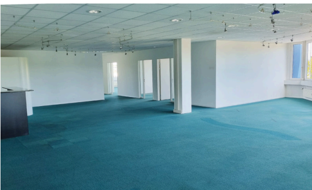
Grossraumbüro und Eingangsbereich