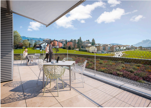
Dachterrasse zur Mitbenützung mit besten Aussichten