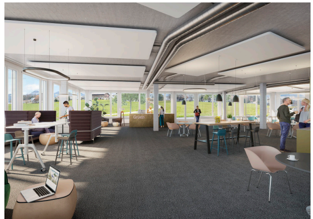
Ausbaubeispiel Büro 1.4.2 im 1. OG (Gebäude 1)