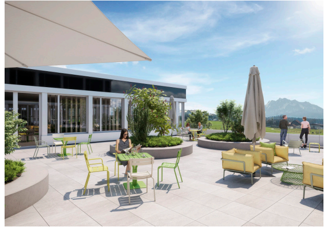
Exklusive, begrünte Terrasse 1. Obergeschoss (Gebäude 3/5)