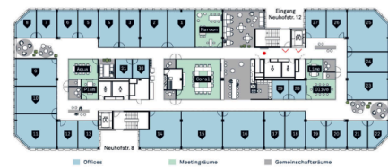
Übersichtsplan - 31 Offices / 6 Meetingräume / ästhetische Gemeinschaftsräume