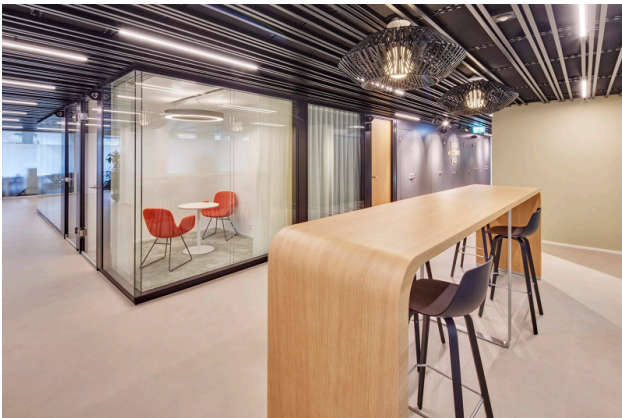
Die Hochtische laden für ein Gespräch unter Büronachbarn ein und die Telefonboxen bieten Ihnen die Möglichkeit Gespräche ganz privat zu führen.