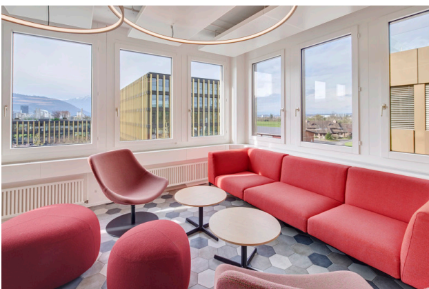
Die komfortablen Lounges laden zu einer kurzen Pause oder einem informellen Austausch ein.