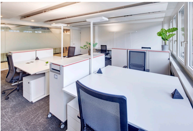
Ihr neues Teamoffice mit Kapazität bis zu 8 Arbeitsplätze (50 m 2 )