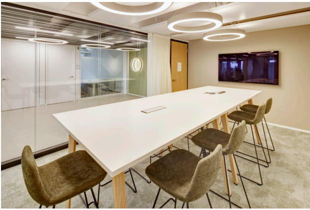
Im .kuia.office. stehen vier Meetingräume, ein Konferenz- und ein Kreativraum zur Verfügung.