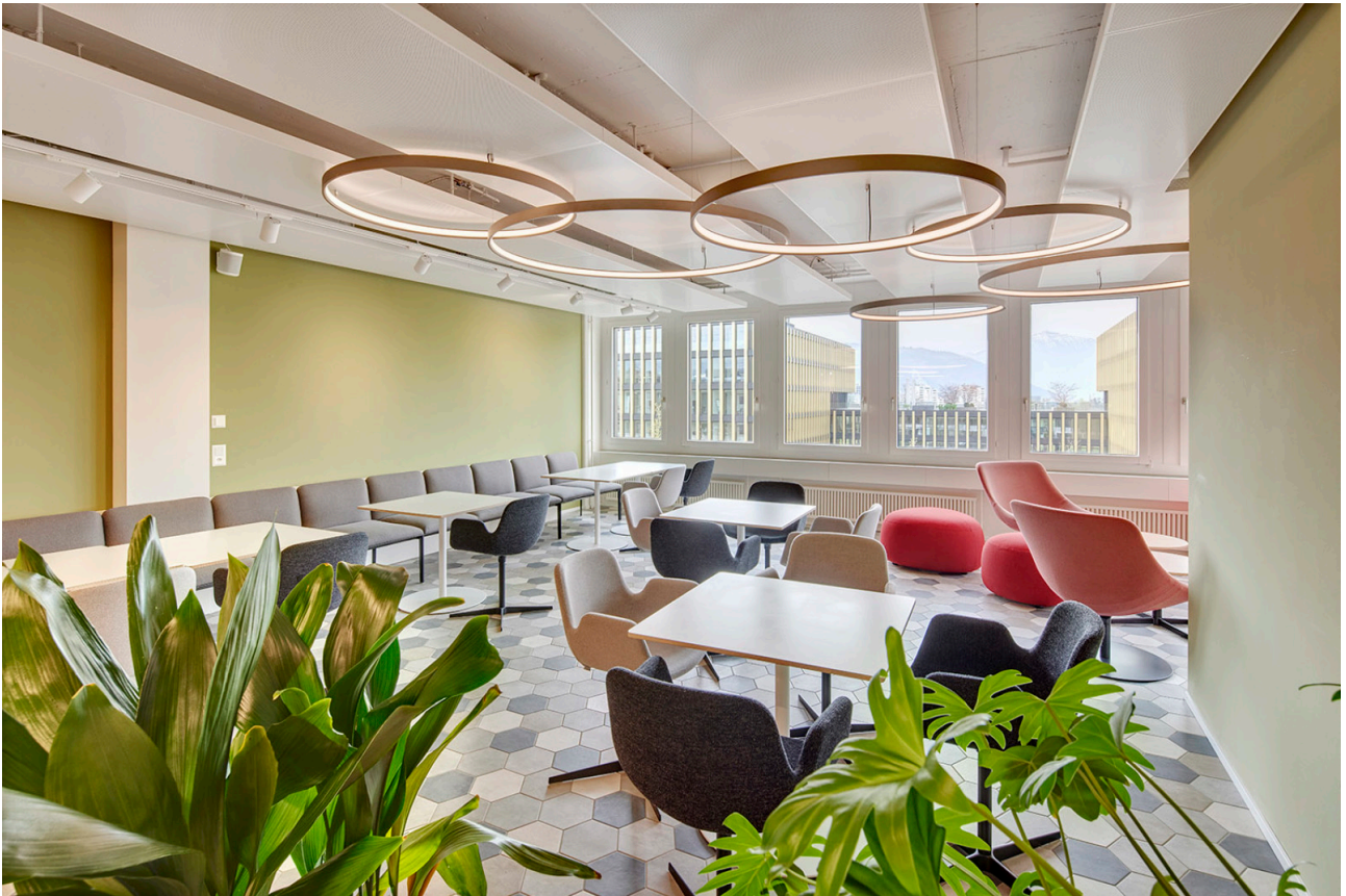
Einladende Gemeinschaftslounge, welche sich direkt neben dem Coffee Corner befindet.