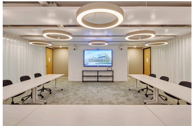
Der Konferenzraum garantiert ein ideales Setup für grössere Besprechungen.