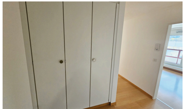
Einbauschränk beim Eingang