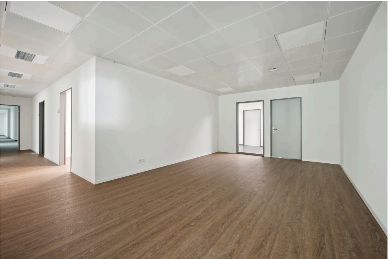
Eingang / Empfangsbereich