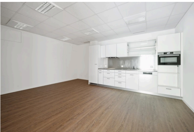
Küche und Aufenthaltsbereich